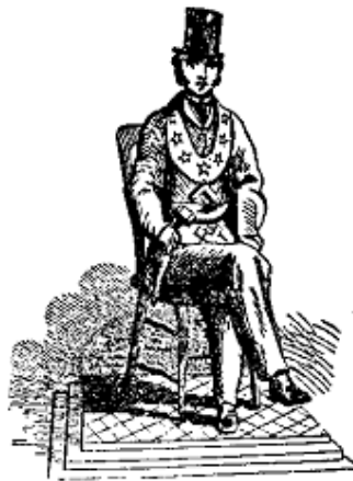
Le Vénérable Maître

Le Rite d'York est très riche en cérémonies aussi bien intérieures qu'extérieures : pose de la première pierre d'un édifice, dédicace d'un temple, dédicace de bannière, anniversaire de loge, enterrements, etc. De plus, les installations de Vénérable Maître peuvent souvent être faites en environnement profane. Il est à noter que dans ce cas, le cérémonial obéit à une procédure particulière occultant une partie du rituel et spécialement la partie confidentielle de l'installation où sont révélés les signes et secrets de Maître installé.